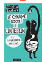
Le charme discret de l'intestin Giulia ENDERS