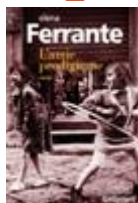
L'amie prodigieuse Elena FERRANTE