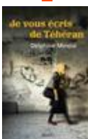
Je vous écris de Teheran Delphine MINOUI