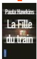
La fille du train Paula HAWKINS