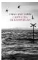
L'opticien de Lampedusa Emma-Jane KIRBY